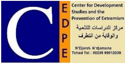
TABLE RONDE SUR LA PREVENTION DE LA VIOLENCE EN MILIEU SCOLAIRE ET LA PROMOTION DU DIALOGUE, le mardi 13 septembre 2022 à 9H A RADISSON BLU HÔTEL, N'DJAMENA.